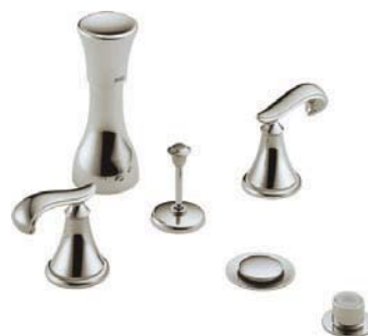
Bidet 44-PNLHP H298PN RP73818PN (fleuron)