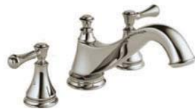
Baignoire romaine à 3 trous T2795-PNLHP R2707 H697PN