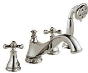
Baignoire romaine à 4 trous T4795-PNLHP R4707 H695PN