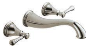
Montage mural 3597LF-PNWL