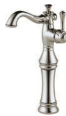
Monotrou avec montée 797LF-PN