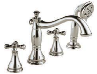
Baignoire romaine à 4 trous T4797-PNLHP R4707 H695PN