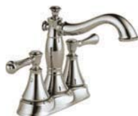
Jeu central de 10,16 cm (4 po) 2597LF-PNMPU