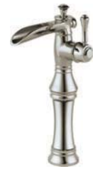
Bec à orifice, monotrou avec montée 798LF-PN