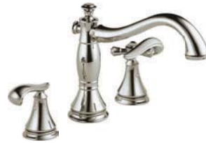
Baignoire romaine à 3 trous T2797-PNLHP R2707 H698PN