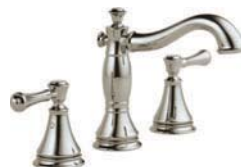
Évasé de 20,32 cm (8 po) 3597LF-PNMPU