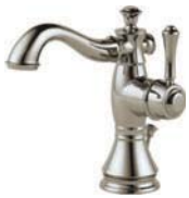
Monotrou 597LF-PNMPU Comprend l'écusson en option