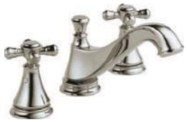
Évasé de 20,32 cm (8 po) 3595LF-PNMPU-LHP H295PN