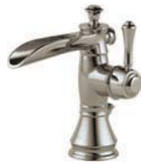
Bec à orifice, monotrou 598LF-PNMPU Comprend l'écusson en option