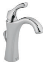
MITIGEUR 592-DST Comprend l'écusson en option