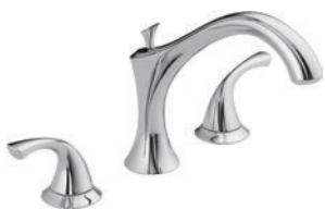
BAIGNOIRE ROMAINE À 3 TROUS T2792 R2707