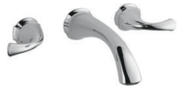
MONTAGE MURAL 3592LF-WL