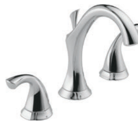
ÉVASÉ À DEUX MANETTES 3592LF