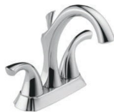
JEU CENTRAL À DEUX MANETTES 2592-MPU-DST