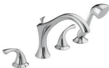
BAIGNOIRE ROMAINE À 4 TROUS T4792 R4707