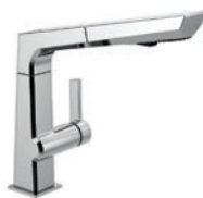
Mitigeur à retrait 4193-DST

Pour installation à 1 ou 3 trous Commander RP92233 pour écusson offert en option