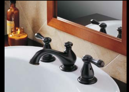
Robinet pour lavabo évasés