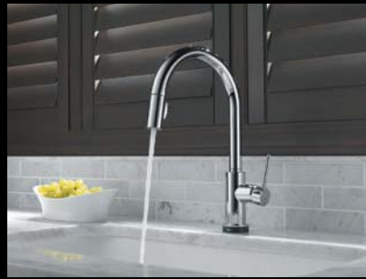
Robinet pour la cuisine doté de la technologie Touch 2 O

Des robinets à tirette, du style traditionnel au style contemporain. Des modèles pour lavabo, mitigeurs ou évasés. Des robinets avec les technologies Touch 2 O MD et Touch 2 O .xt MC . La technologie d'étanchéité DIAMOND MC est intégrée à un éventail de configurations de robinet, offerte pour presque tous les styles et toutes les fonctionnalités proposées par Delta Faucet.