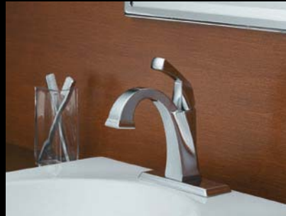
Mitigeurs pour lavabo