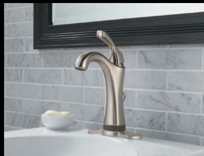
Robinet pour lavabo doté de la technologie Touch 2 O .xt