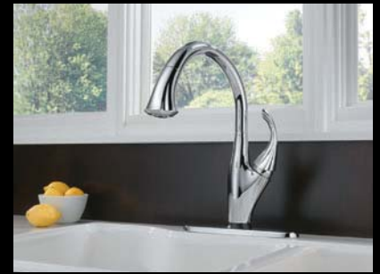
Mitigeurs à tirette et à retrait pour la cuisine