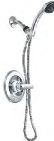
MONITOR® 13 SERIES SHOWER ONLY HANDSHOWER TRIM SÉRIE MONITOR® 13 GARNITURE POUR DOUCHE SEULEMENT AVEC DOUCHETTE

T13420-CDN T13420-SOS-CDN (Slip-on spout/ Bec à glissement)