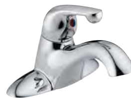
SINGLE HANDLE LAVATORY FAUCET MITIGEUR DE LAVABO