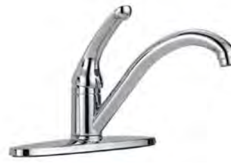
SINGLE HANDLE KITCHEN FAUCET MITIGEUR POUR LA CUISINE