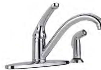
SINGLE HANDLE KITCHEN FAUCET WITH CHROME SPRAYER MOUNTED ON DECK