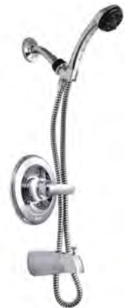
MONITOR® 13 SERIES TUB/HANDSHOWER TRIM SÉRIE MONITOR® 13 GARNITURE POUR BAIGNOIRE AVEC DOUCHETTE