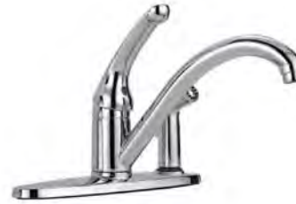
SINGLE HANDLE KITCHEN FAUCET WITH INTEGRAL CHROME SPRAYER MOUNTED ON ESCUTCHEON