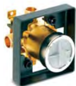
MULTICHOICE® UNIVERSAL VALVE LA SOUPAPE UNIVERSELLE MULTICHOICE®

The MultiChoice® Universal Valve provides a single rough that offers three function options and multiple style choices for unlimited design flexibility. With its universal application, the MultiChoice Universal Valve also streamlines installation. So when you're selecting shower options, you don't have to worry about the plumbing behind the wall. One rough does it all.