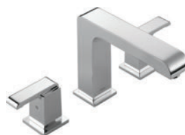
BAIGNOIRE ROMAINE À 3 TROUS T2786 R2707