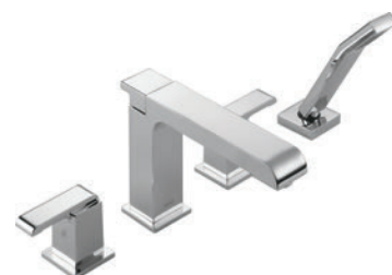
BAIGNOIRE ROMAINE À 4 TROUS T4786 R4707