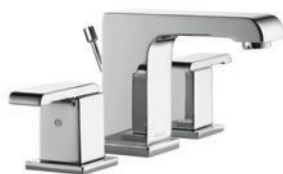
ÉVASÉ À DEUX MANETTES 3586LF-MPU