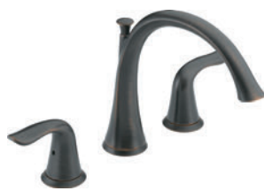
BAIGNOIRE ROMAINE À 3 TROUS T2738-RB R2707