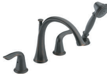
BAIGNOIRE ROMAINE À 4 TROUS T4738-RB R4707