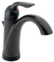
MITIGEUR AVEC LA TECHNOLOGIE TOUCH2O.XT 538T-RB-DST Comprend l'écusson en option