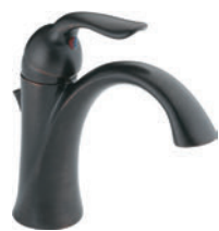
MITIGEUR 538-RBMPU-DST Comprend l'écusson en option