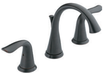
ÉVASÉ À DEUX MANETTES 3538-RBMPU-DST