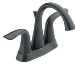
JEU CENTRAL À DEUX MANETTES 2538-RBMPU-DST