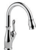
MITIGEUR À TIRETTE 9178-DST Installation à 1 ou à 3 trous Ancrage MagnaTite Comprend l'écusson en option