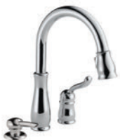
MITIGEUR À TIRETTE 978-DST AVEC RP50813 DISTRIBUTEUR DE SAVON Installation à 3 trous Ancrage MagnaTite