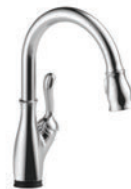
MITIGEUR À TIRETTE AVEC LA TECHNOLOGIE TOUCH2O MD 9178T-DST Installation à 1 ou à 3 trous Technologie TempSense MC Ancrage MagnaTite MD Comprend l'écusson en option