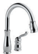
MITIGEUR À TIRETTE 978-DST Installation à 2 trous Ancrage MagnaTite